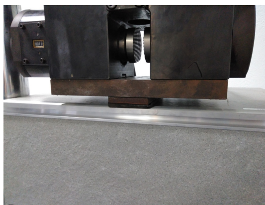
Ensayo de carga Novopeldaño Eclipse®