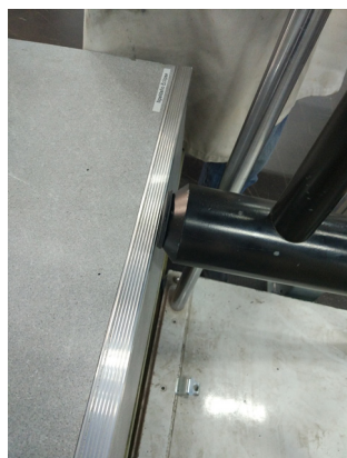
Ensayo a impacto Novopeldaño Eclipse®